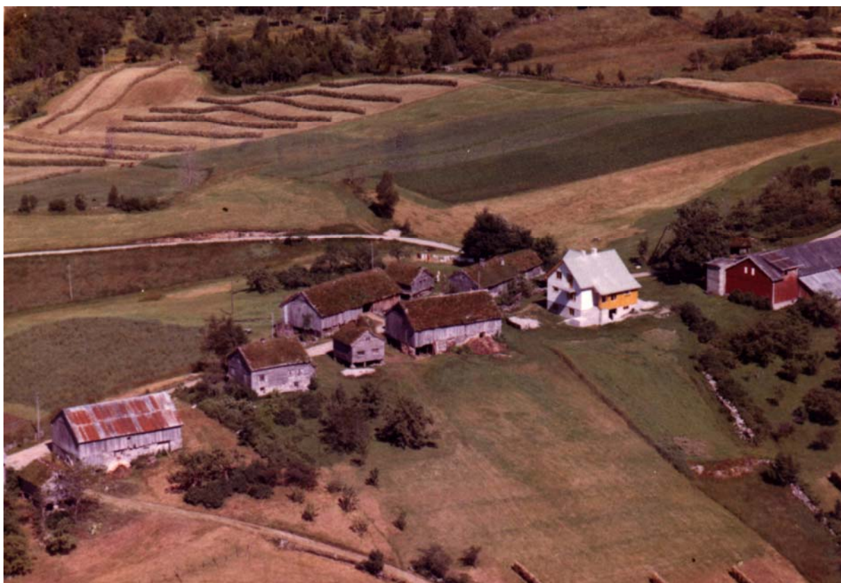
Frå venstre: Nygards-løa, Knut- stova, J o-løa ,Knut- stabburet, Knut-løa, Jo-stabburet, Jo-stova Det nye huset er Jørn-stova.