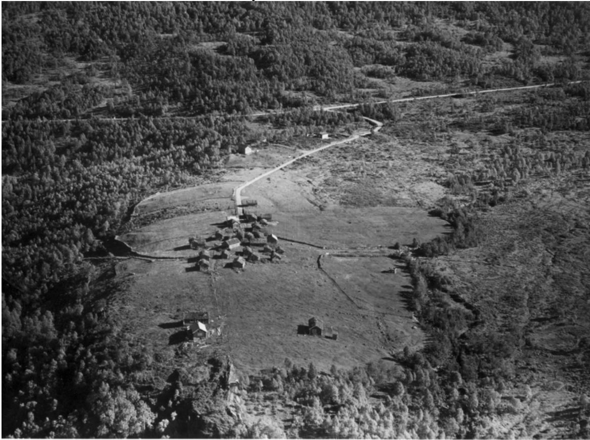
Hjorthol, Brøvoll og Hole har sæterhusa sine på Myrdalen.