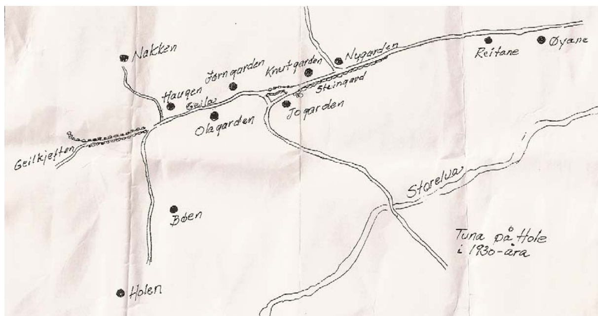
Jon Hole har laga denne skissa over tuna på Hole i 1930 åra.