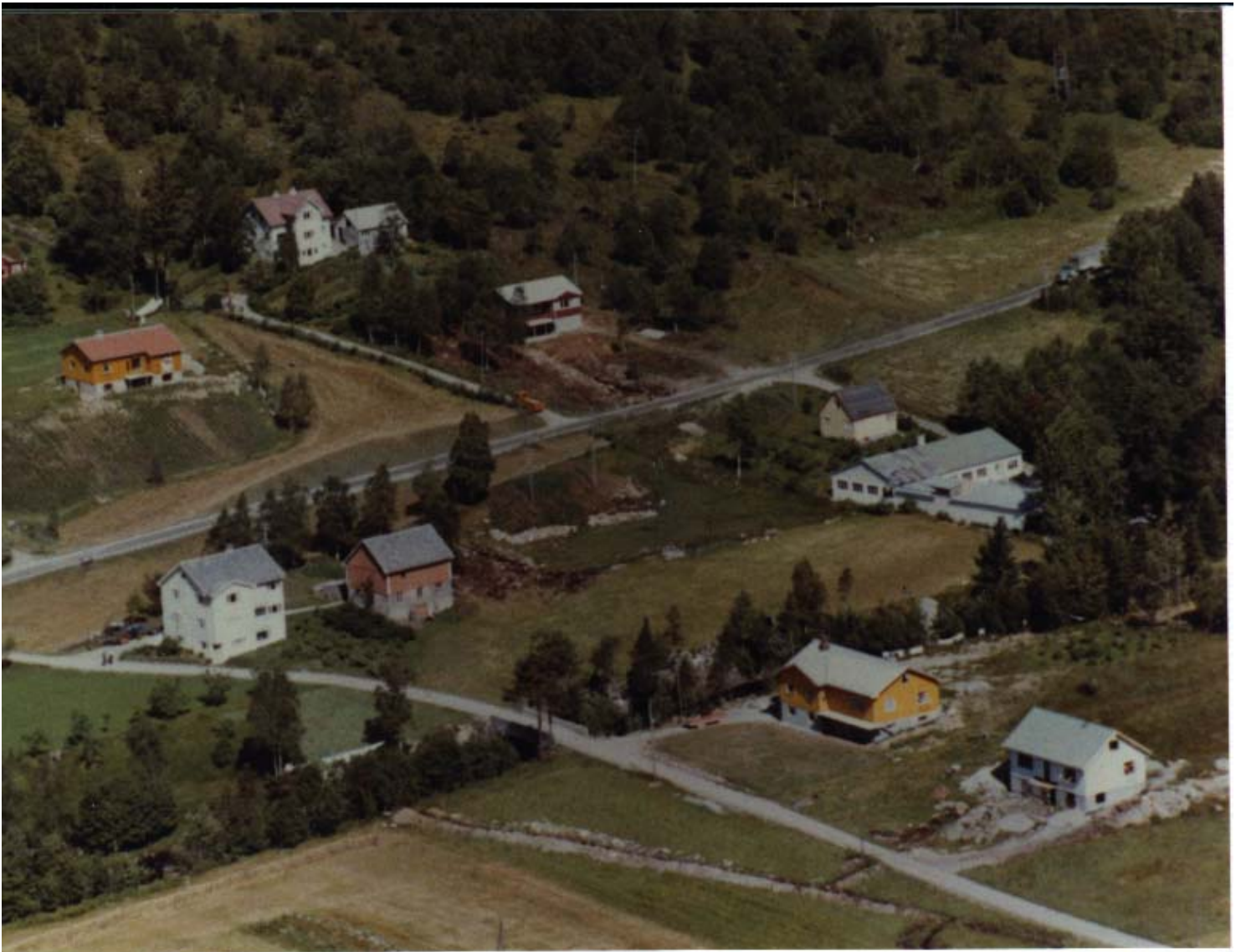
Brøvollsgjerde og Øyane.